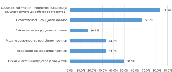
Графикон 2: Главни предизвици во ЛУУД секторот (како % од вкупните одговори)